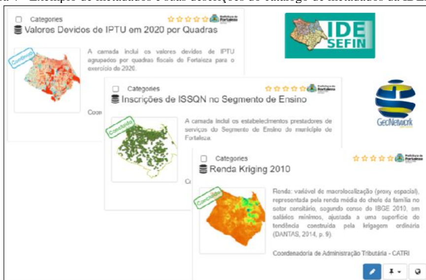
Figura 4 - Exemplo de metadados e suas descrições do catálogo de metadados da IDESEFIN

elementos que deve ser comum a todos os perfis de metadados no Brasil, de forma que seja garantido a interoperabilidade entre as mais diversas implementações que se propõem em disseminar informações espaciais, promovendo enfim, como aponta o Decreto nº 6.666 de 2018, sua documentação, possibilitando a busca e exploração dos dados espaciais correspondentes (art. 2º, inciso II).